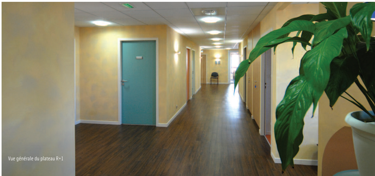
Vue générale du plateau R+1