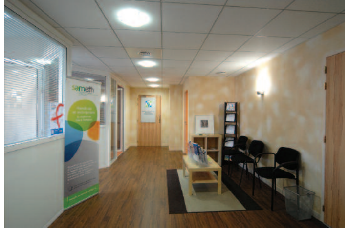
Salon d'attente partenaires