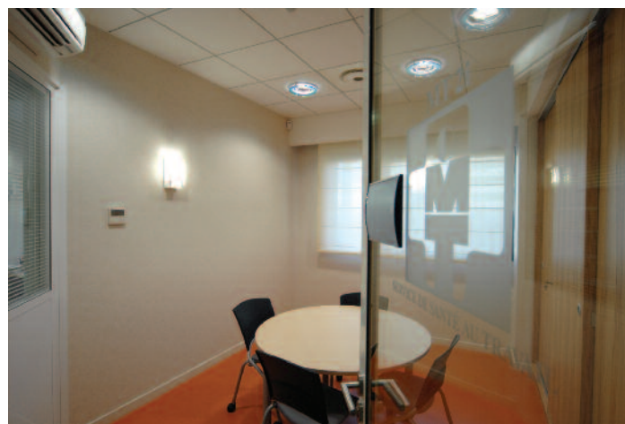
Salle de réception