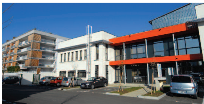
Locaux ZAC centre St-Martin-d'Hères