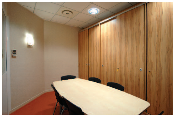
Salle de réunions