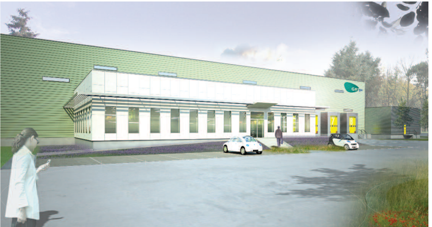
Entrée des bureaux