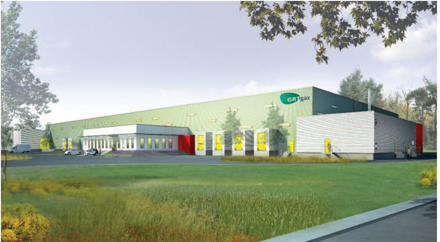
Vue depuis l'entrée du site

Conception : atelier Philippe Jammet architecte