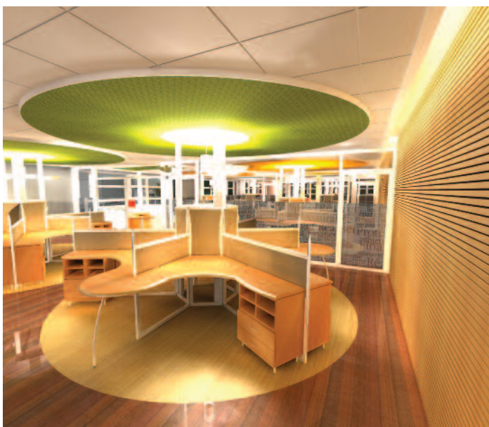
Perspective Architecturale – St-Martin-d'Hères

La Caisse d'Épargne Rhône-Alpes a confié à l'atelier Philippe Jammé architecte et Alchemy Design la restructuration intérieure de plusieurs plateaux de ses sites techniques. Les projets présentés correspondent à des centres névralgiques de la relation commerciale (CRC) associés à la Banque à distance (Mon banquier en ligne). Ces projets de design d'environnement touchent très directement les utilisateurs qui doivent être dans les meilleures dispositions ergonomiques puisque leur seul contact avec la clientèle est phonique : le « sourire » s'entend. Dans cet esprit, l'approche conceptuelle s'appuie sur l'aspect acoustique des lieux dans leur ensemble mais également sur tout ce qui permet à l'utilisateur d'obtenir le meilleur confort possible : absorption acoustique, ergonomie des postes de travail, environnement intérieur valorisant l'esprit d'unité des équipes commerciales, reconnaissance et adéquation à un univers de travail ludique mais tourné vers l'efficacité de l'accroche du « phoning » en terme à la fois de prospects et de réponses aux problématiques de la clientèle en ligne. Ces « Centres de Relations Commerciales » de Lyon et Grenoble synthétisent et concentrent l'ensemble des échanges téléphoniques du réseau de 320 points de vente de la Caisse d'Épargne Rhône-Alpes.