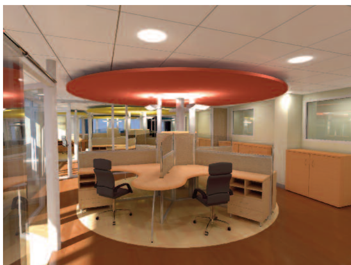
Perspective architecturale – Lyon