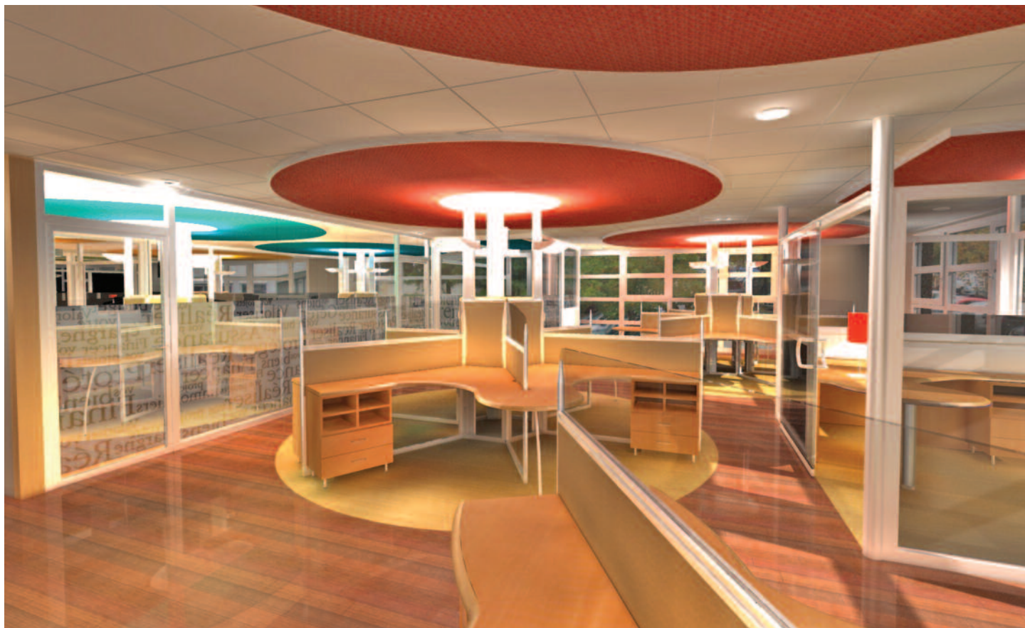
Vue d'ensemble du plateau de St-Martin-d'Hères

Localisation : sites de Grenoble et Lyon