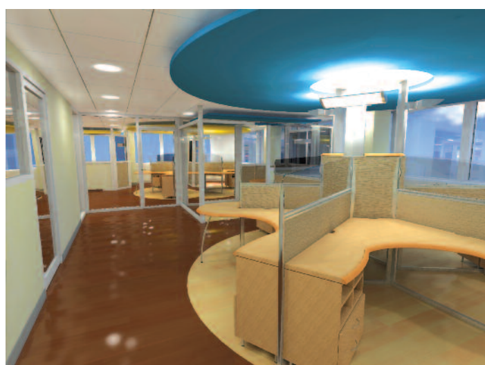
Vue d'ensemble – Lyon