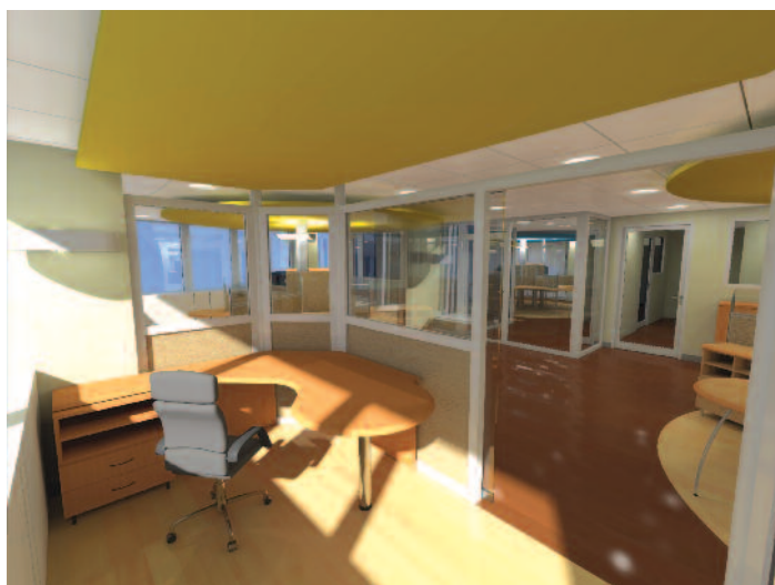
Vue d'ensemble – Lyon