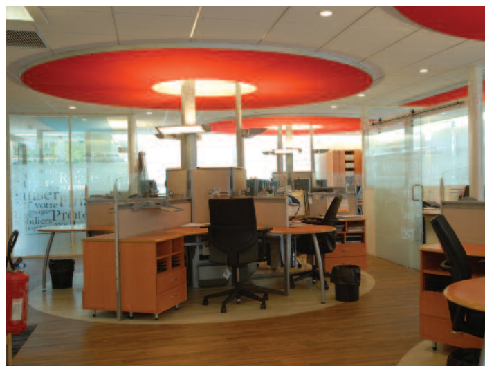
Rosaces et postes de travail – St-Martin-d'Hères