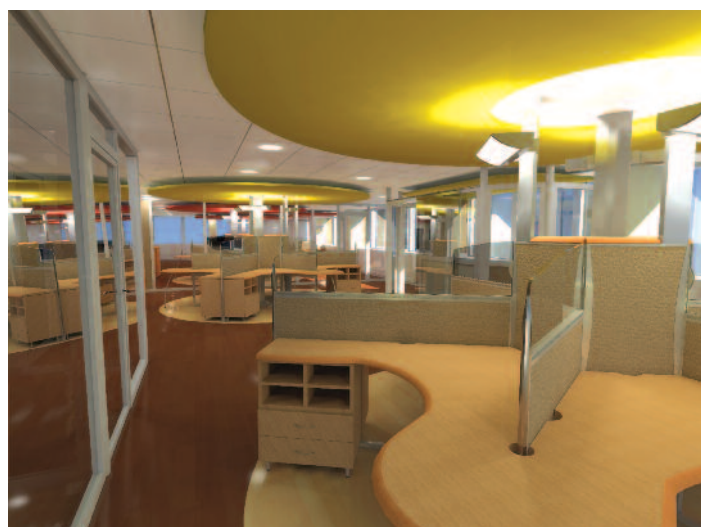
Rosaces et postes de travail – Lyon