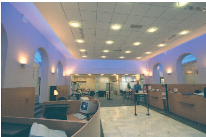
Agence bancaire centrale