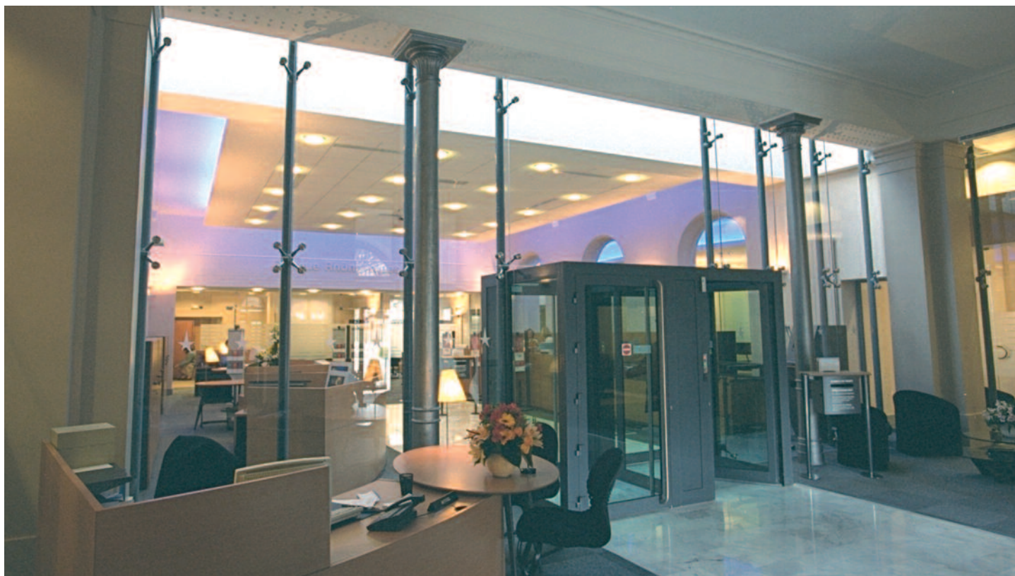
Détail ambiance intérieure du hall d'entrée

DIAG /Faisabilité : Crédit du Nord/DIS Conception + Économie + OPC : Philippe Jammet architecte Bet CVC : ETF Bet Structure : CEBEA Surface : 2 400 m 2 (R+3) Budget travaux : 2 M€ TTC Mission de base + EXE + OPC Année : 1998 à 2001