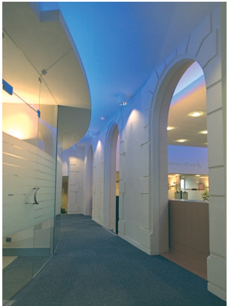
Restauration d'anciennes façades