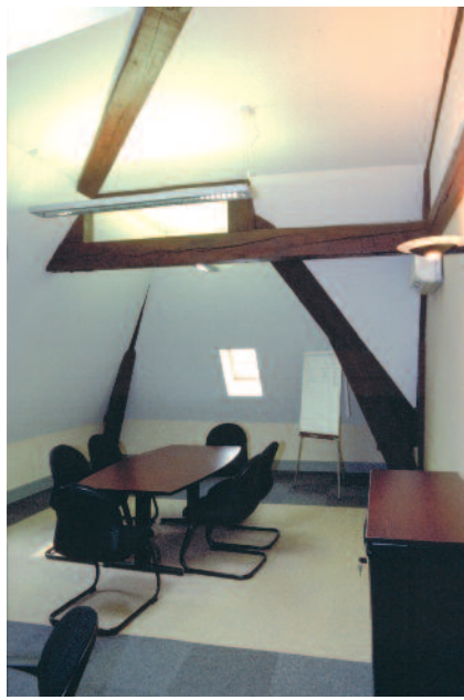
Aménagement des combles