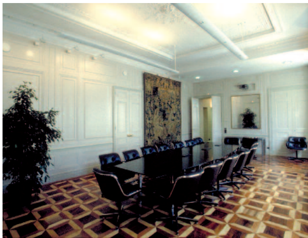
Salle du conseil