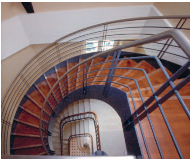
Extension de l'escalier d'honneur