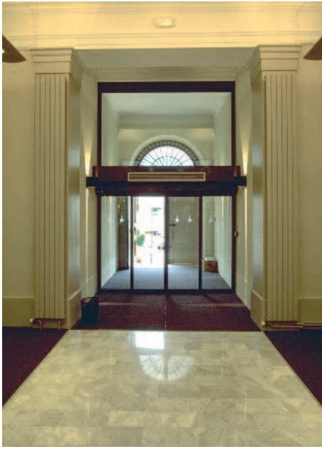
Entrée du siège